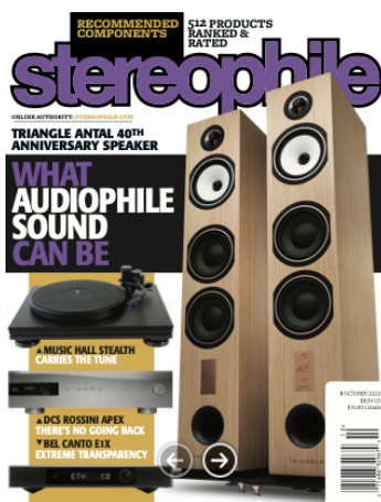
Magazine Stereophile USA - Octobre 2022