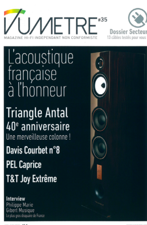
Magazine VuMètre France - Juin 2021