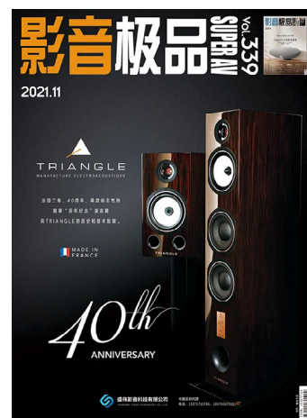
Magazine SuperAV USA - Novembre 2021

« Outre de prestigieuses conceptions, la marque a su proposer des enceintes aux prestations remarquables à un prix contenu. [...] Avec cette nouvelle mouture des Antal, TRIANGLE annonce un équipement «milieu de gamme». S'il est par le prix, il nous semble qu'il fait bien mieux que ce que pourrait laisser supposer cette appellation en termes de capacités de restitution. Les Antal 40 TH ne manquent pas d'atouts et pourraient en remonter à certains systèmes souvent beaucoup plus coûteux. »