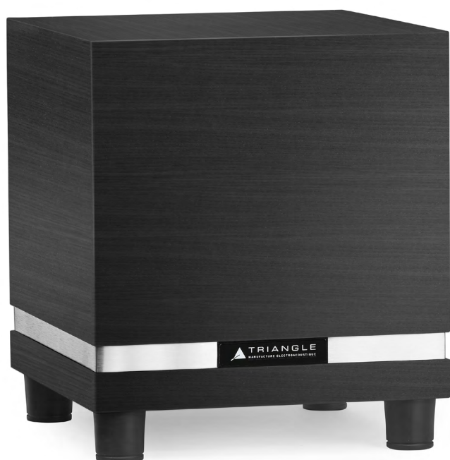
Caisson de grave Thétis 340 - Noir Cendré

Fidèles à l'ADN de la marque, ces caissons de taille compacte sont polyvalents et peuvent être utilisés aussi bien dans un ensemble Home Cinéma qu'en complément d'un système stéréo.