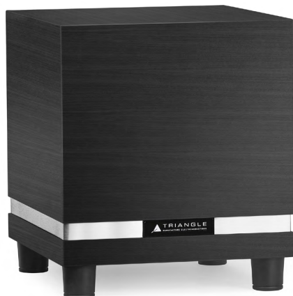
THETIS 340 749€ Finition Bois

Les caissons Thétis 340 & 300 sont disponibles dès à présent en 3 finitions : Noir Laqué, Blanc Laqué et Noir Cendré.