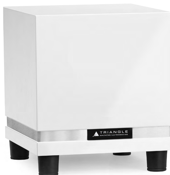
Caisson de grave Thétis 300 - Blanc Laqué

Disponibles en 3 finitions : Bois noir, Noir Laqué et Blanc Laqué, ils s'intégreront aisément dans tous types d'intérieur avec sobriété et élégance.