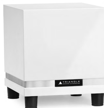
THETIS 300 599€ Finition Bois