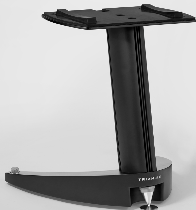
S08-C Fiche Produit

Le support S08-C est destiné aux voies centrales haut de gamme. L'enceinte ainsi positionnée à hauteur optimale sur son support, assure une parfaite restitution sans perturber le champ de vision de votre télévision ou de votre écran de projection.