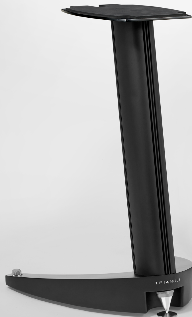
S08 Fiche Produit

Les supports S08 sont conçus pour accueillir des enceintes de type bibliothèque haut de gamme. Pensés pour le modèle TRIANGLE MAGELLAN Duetto 40 TH , ils intègrent un système de verrouillage assurant un parfait maintien et une excellente stabilité de l'enceinte.