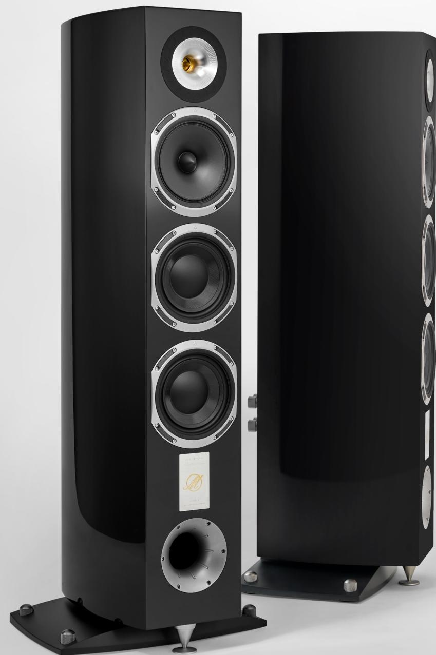
MAGELLAN Cello 40 TH Fiche Produit