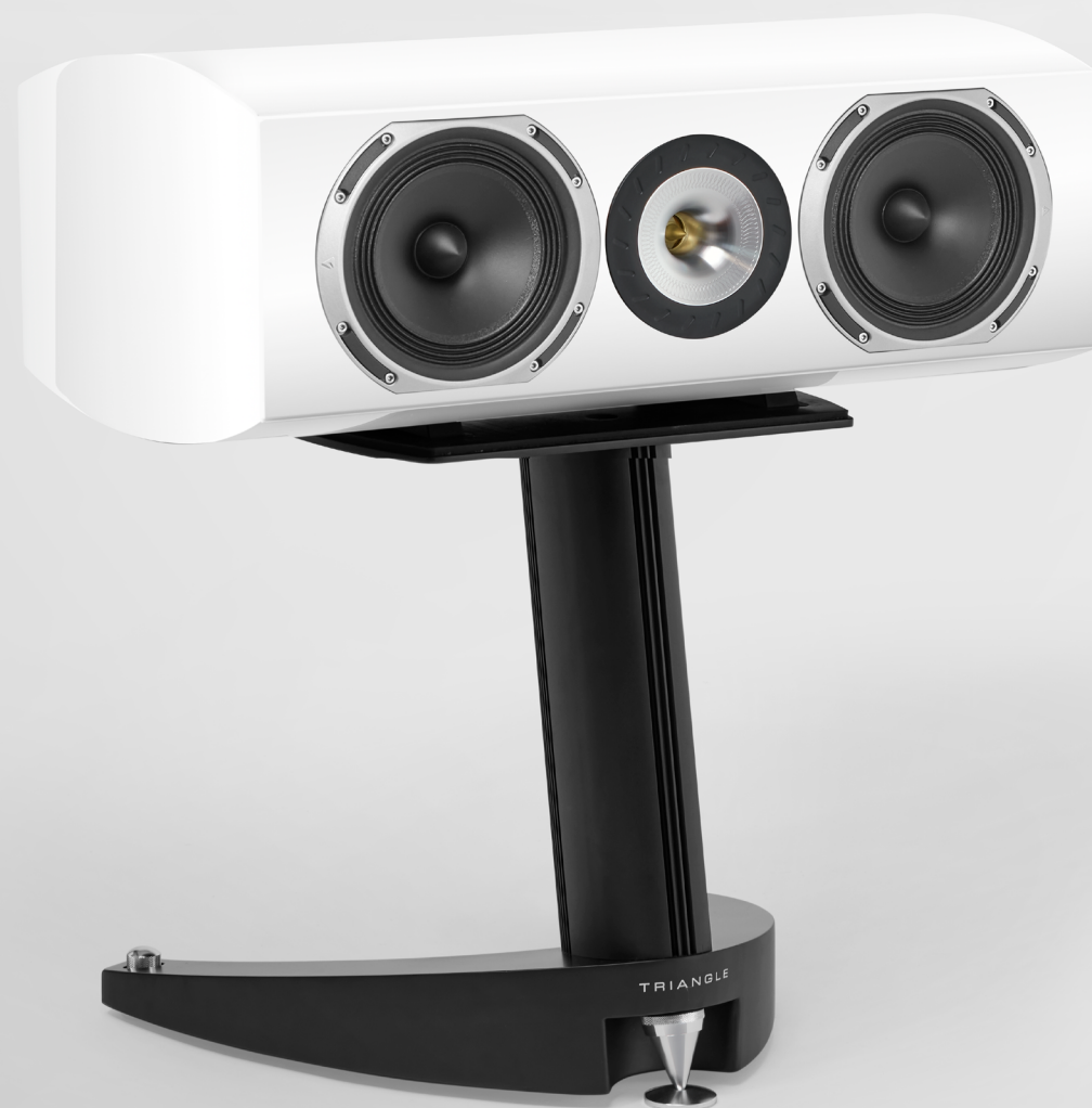
MAGELLAN Voce 40 TH Fiche Produit