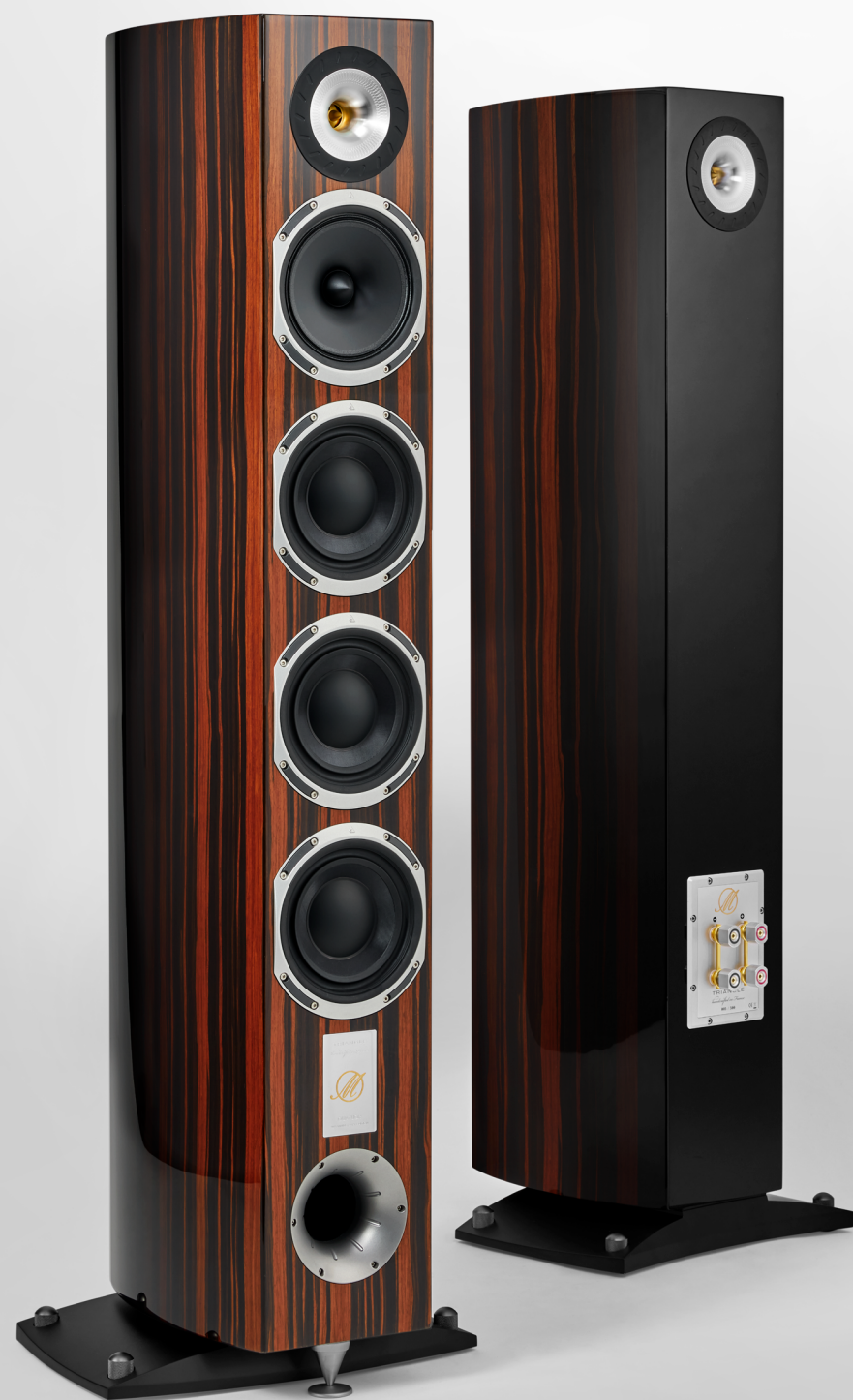
MAGELLAN Quatuor 40 TH Fiche Produit